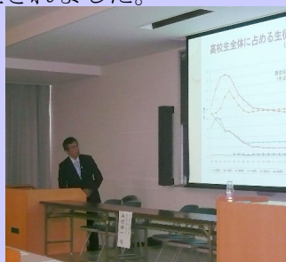
講演：西村教科調査官