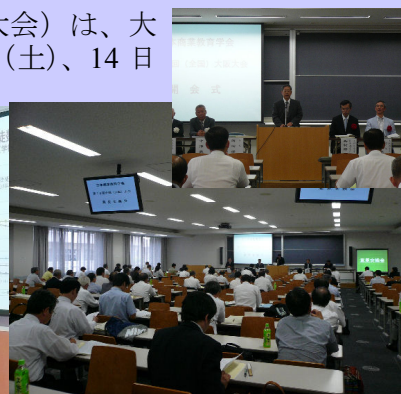
上:岡田会長 下：研究発表の様子