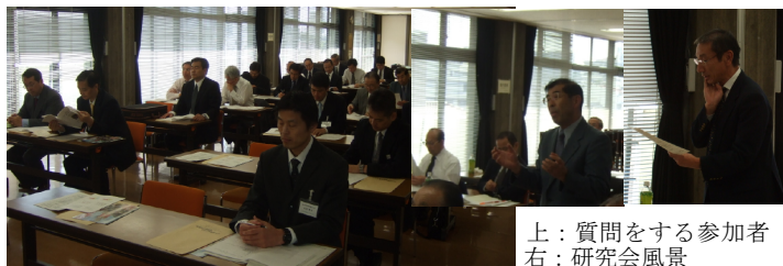
上：質問をする参加者 右：研究会風景