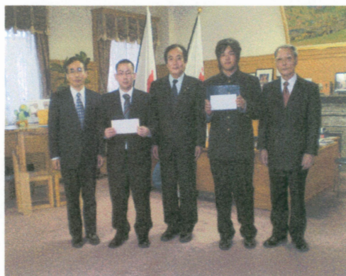
知事表敬訪問（深谷商業高校情報会計専攻科、浦和商业高校商業科 税理士試験2科目同時合格報告 H20.1.21）