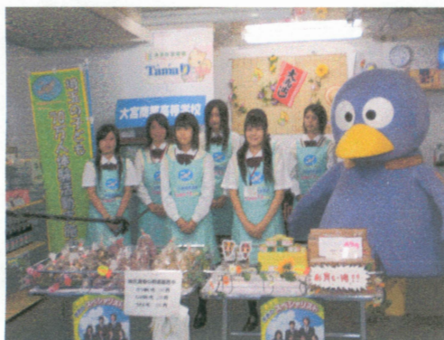
大宮商業高校チャレンジショップ（テレビ埼玉撮影風景 H19.9.21）